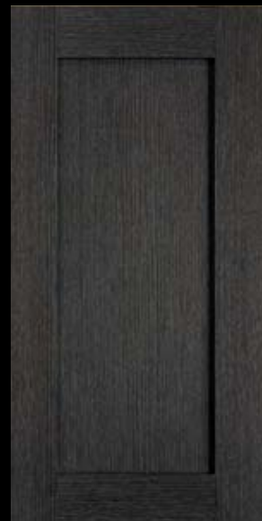
1830 Café Oak, fini Legno Café Oak, Legno finish