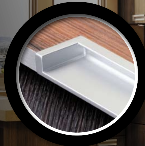
Poignée | Handle 10 (128 mm) Poignée | Handle 20 (160 mm)