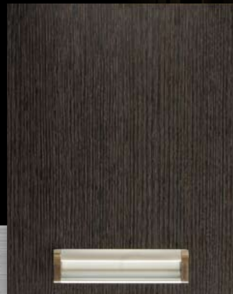
Poignée 40 en aluminium, encastrée à un pouce du bord Aluminum handle 40 inlaid at 1" from bottom edge