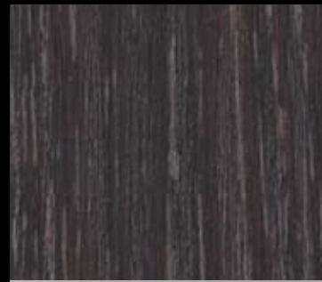
CAFÉ OAK | 1830