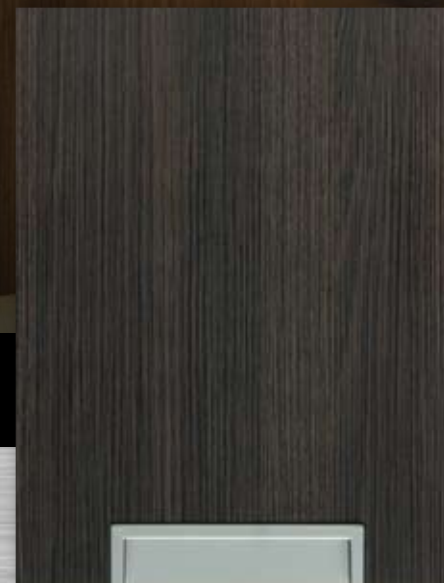
Poignée 20 en aluminium, encastrée et excédant 1/16" du bord Aluminum handle 20 inlaid and exceeding 1/16" over bottom edge