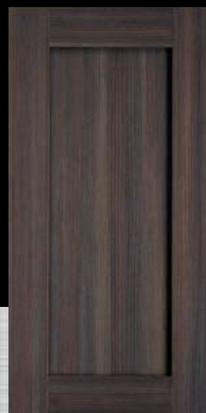
1838 Alerce, fini Legno Alerce, Legno finish