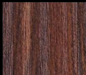
PALISANDER | 1839

LES STRATIFIÉS UTILISÉS POUR LA SÉRIE «PURE» SONT SOIGNEUSEMENT CHOISIS AFIN DE REPRODUIRE LA TEXTURE NATURELLE DU BOIS EXOTIQUE.