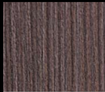
ALERCE | 1838