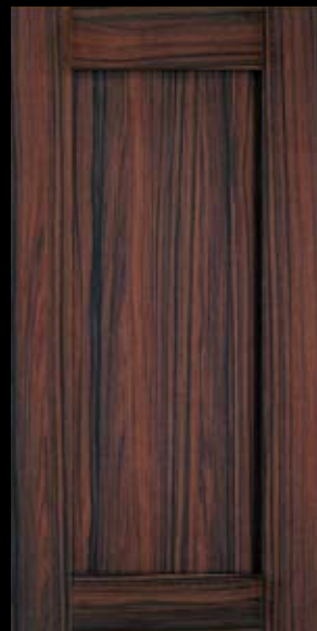
1839 Palisander, fini Legno Palisander, Legno finish