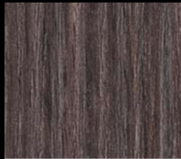
BROWN OAK | 1836