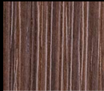
NOCE | 1841