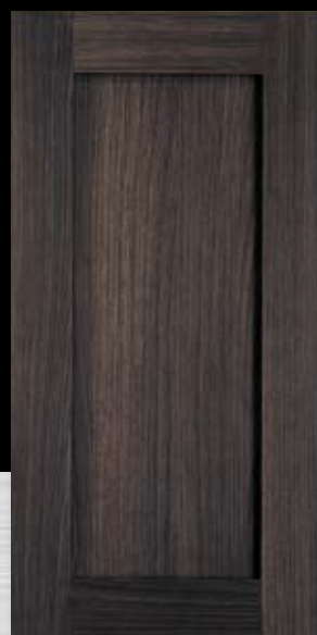
1836 Brown Oak, fini Legno Brown Oak, Legno finish