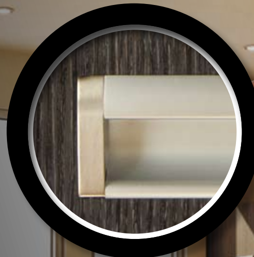
Poignée | Handle 30 (128 mm) Poignée | Handle 40 (160 mm)